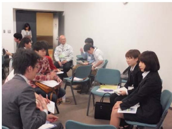
インターンに興味のある人から たくさんの質問がありました