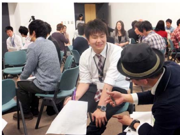
プレゼンが全て終了し、 参加者を交えて質問・相談セッション