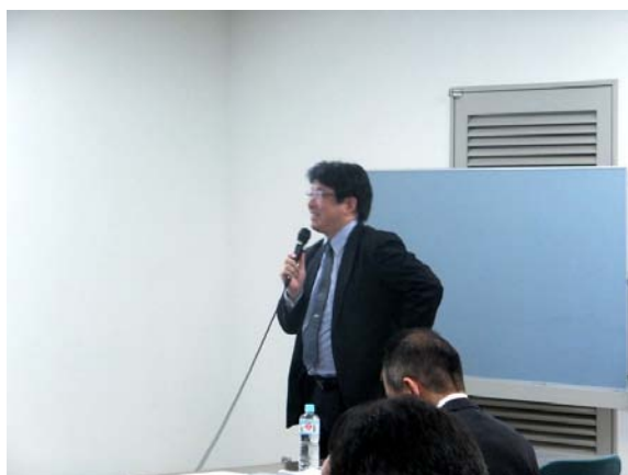
審査員長をさせていただいた チャレンジ・コミュニティ・パートナーズの 松崎さまからのコメント