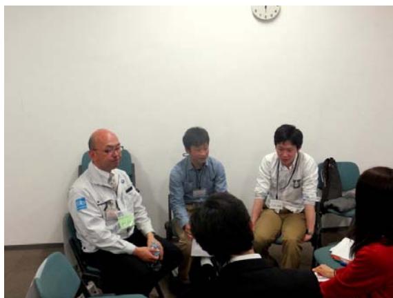
先ほどプレゼンをしたインターン生も 質問に答えます