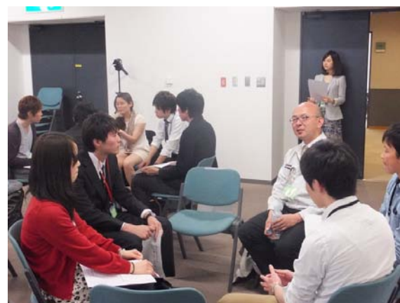
実体験を交えた 詳しい内容が聞けたようです