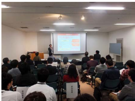
社会人が17名、学生が6名と 今回もたくさんの方にご来場いただきました