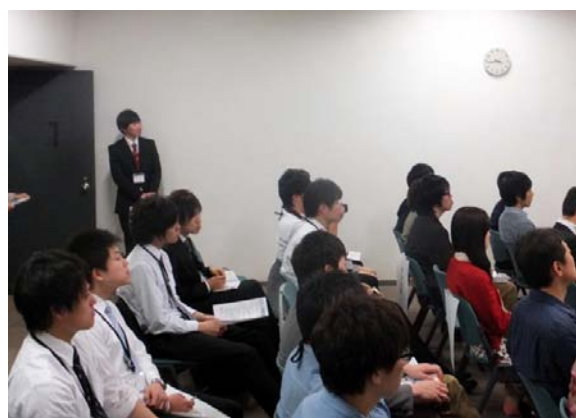
プレゼンテーションを前に、 緊張した面持ちのインターンシップ生たち