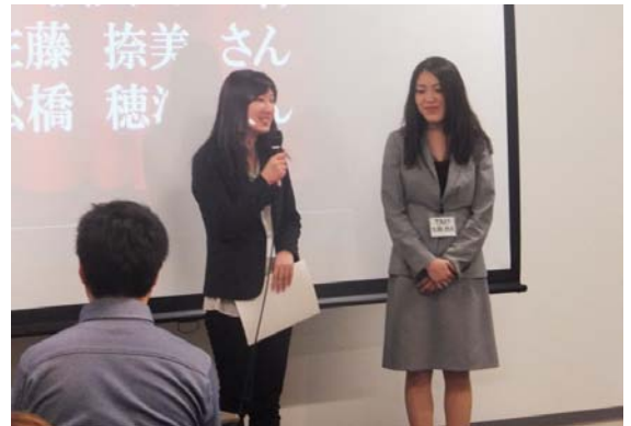
ふたりとも大喜びの様子 最優秀賞は狙っていたとか？！