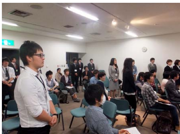
審査結果発表の前に、 インターン生の修了証書授与式